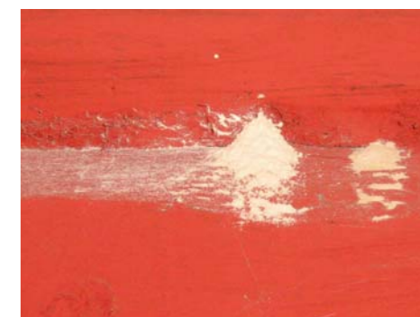
▲ Koid on närinud maja seina hulganisti auke.