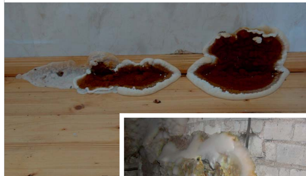
▲ Nii näeb välja majavanni viljakeha.

Nüüd mõned iseloomulikud faktid ka enim levinud puitumädandavatest kandseentest. Vähesed leviku ja artikli piiratud mahu tõttu jäävad valge- ja pehmemädanikke tekitavad seened tutvustamata ning keskendumise pruunmädanikke tekitavate kandseentele.