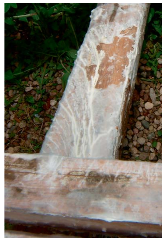
▲ Majanääts ehk Antrodia sinuosa .

Lisainfo: kalle.pilt@emu.ee või Eesti Mükoloogia Uuringutekeskus SA info@mycology.ee. Eestikeelset nimetused on toodud raamatu "Eesti seente koondnimestik" 1 täienduskõide (1975–1990) põhjal.