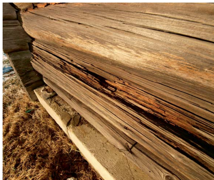
◀ Puidu on pinnal näha kiudude katkemist ning kogu palgi pealmine kiht on muutunud muredaks. Sellega on hakkama sanud päikesekiirgus.

Kahes eelmises numbris tutvustasime puitu kui universaalset ja imelist ehitusmaterjali. See-kord jätkame puidu mehaanilisi omadusi mõjutavate teguritega, milleks on nii UV-kiirgus kui ka kõikvõimalikud puidukahjurid.