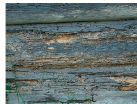
▲ Mardikad on palkseina kallal kurja tööd teinud.

Mööbli-toonesepp vastsete olemasolust puidus annab teada 1–2 mm suuruste ümara-