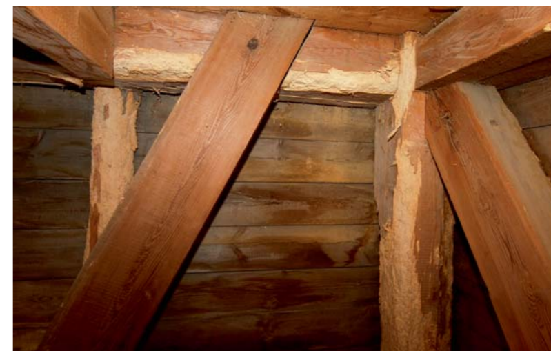
◀ Majasikk on oma tegevuse jäljed jätnud Ruhnu saare puitmajja.

te sisenemis- ja lennuavade olemasolu puidu pinnal või ka tolmja puidupulber puitdetailide all või vahetus läheduses. Vastsete toitumisel tekib vaikne tiksuv hääl, mis meenutab sepavasara või rähni toksimist. Mardikad on 3–5 mm pikad, vastsed kaarjad, kuni 6 mm pikad. Kindlasti on oluline, et mööbli-tooneseppa vastset kahjustavad puitu kogu ristlõike ulatuses. Siiski on tema eelistuseks suure niiskusesisaldusega* puit või siis seentest "pehmendatud" puit, oma nime on ta saanud sellest, et kahjustab ka mööblidetaile.